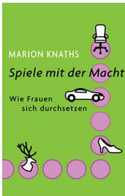
Vom Hamburger Abendblatt ausgezeichnet "Spiele mit der Macht. Wie Frauen sich durchsetzen"