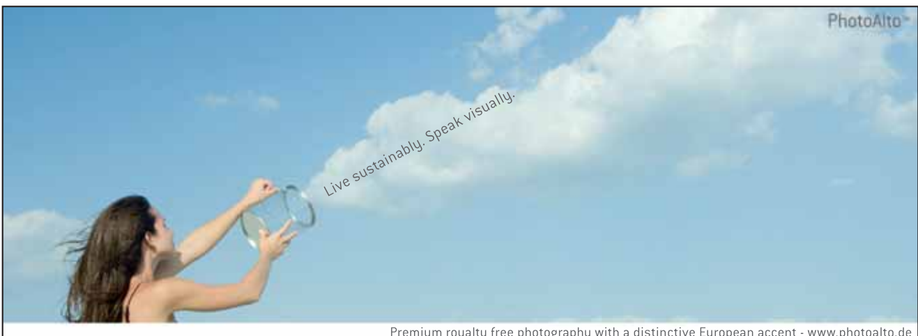
Premium royalty free photography with a distinctive European accent - www.photoalto.de

EUMA freut sich auf die nächsten Besuche und eine weiterhin so angenehme Zusammenarbeit.